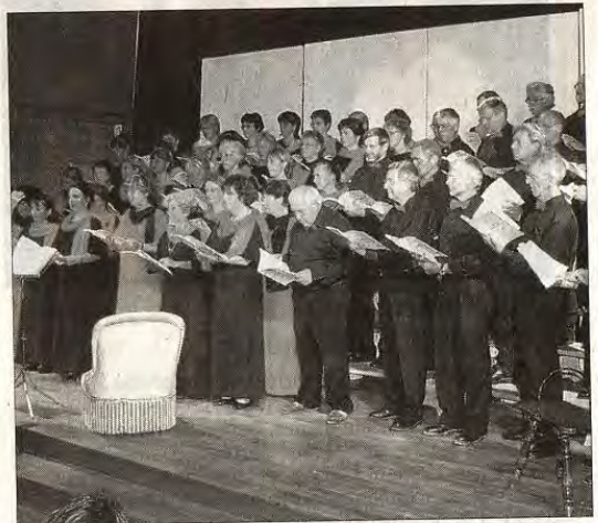
L'ensemble vocal "Cant'Ouvève" et l'ensemble vocal Christine Paillard seront en concert dimanche à 18 h dans la salle des Fêtes.

Entrée : 15 € (moins de 16 ans : 10 €). Réservations par téléphone au 04 75 28 34 64 ou 06 86 36 52 15 ou à l'office de tourisme de Buis 04 75 28 04 59 et sur le site internet : www.serenadesenbaronnies.com