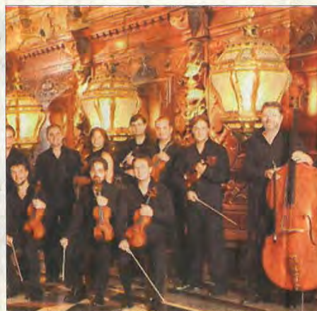
L'orchestre à cordes "Interpreti Veneziani" viendra de Venise pour interpréter Vivaldi.

Les abonnés et ceux qui font une réservation au moins une semaine avant le concert ont des places réservées dans la salle.