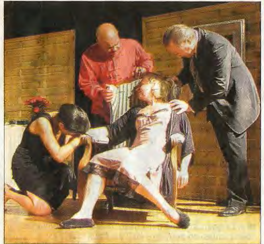
La fin tragique de Violetta clôt de façon particulièrement poignante le troisième acte de "La Traviata".

Le prochain et dernier concert de l'année des "Sérénades en Baronnie" sera donné le dimanche 26 septembre à 18 heures dans la salle des fêtes de Buis. Au menu, des musiques sacrées d'Amérique latine et "Misa Criola" interprétées par l'ensemble vocal Cantouève et l'ensemble vocal Christine Paillard accompagné par le groupe de musique Andine "Los Caprichos".